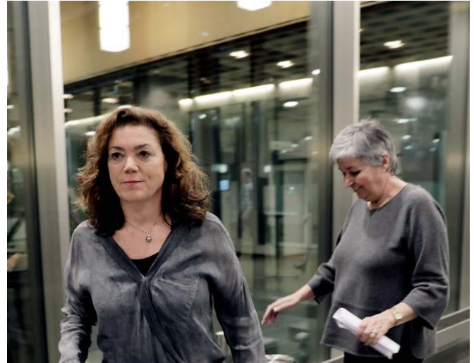
NHO-sjef Kristin Skogen Lund og LO-leder Gerd Kristiansen på vei ut for å møte pressen etter å ha blitt enige om rammen for lønnsoppgjøret 2017.

- Med så høye lavlønns tillegg, vil det for flere bedrifter være lite rom for lokale lønns tillegg. Spesielt innen reiseliv er dette krevende da partene for første gang skal gjennomføre lokale forhandlinger, sier Skogen Lund.